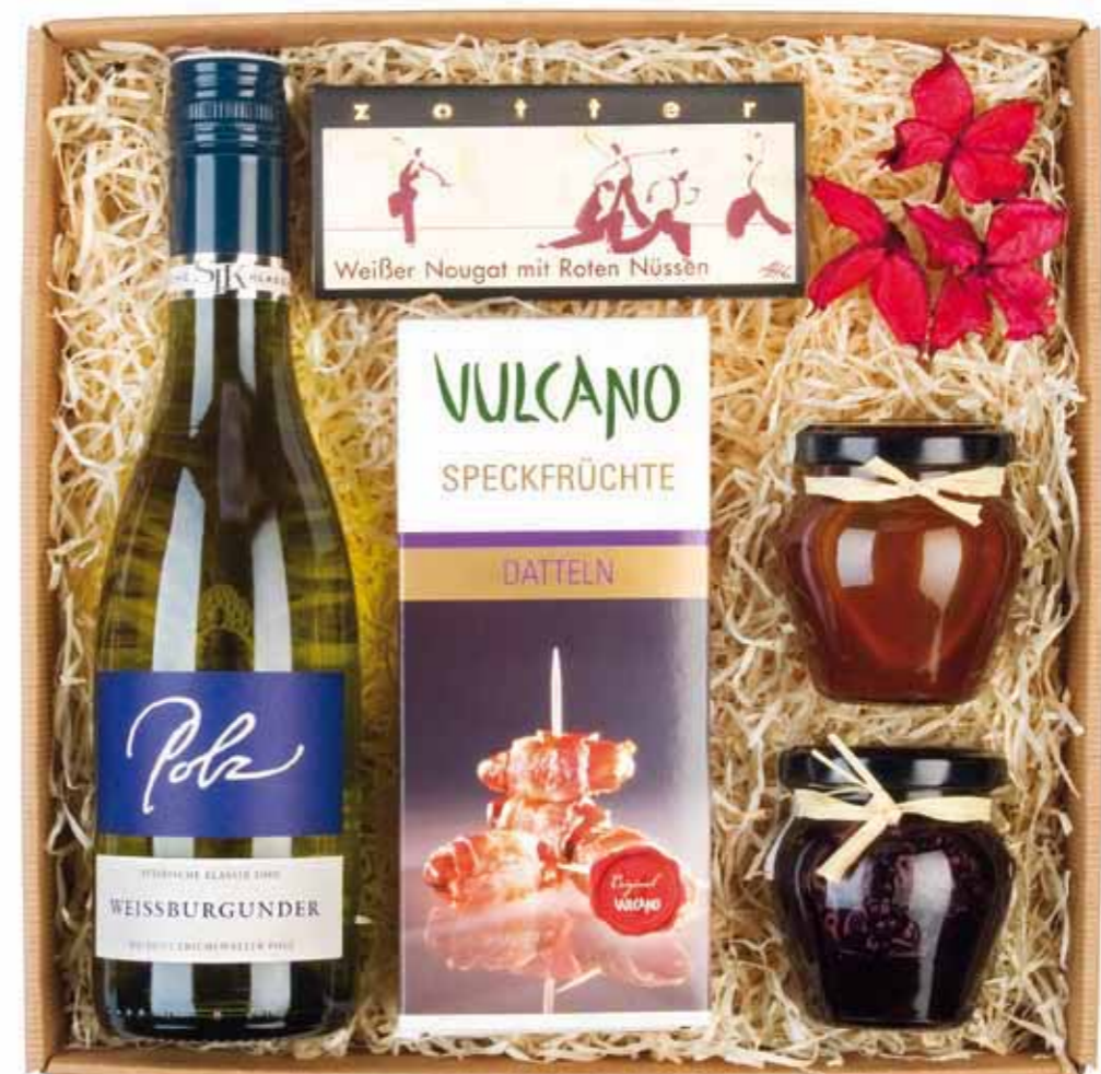
N° 8 Eine Flasche Weissburgunder Steirische Klassik vom Weingut Polz 0,375l Hollerkoch von Retzer Delikatessen 100g Chili-Hagebutten-Marmelade von Retzer Delikatessen 100g