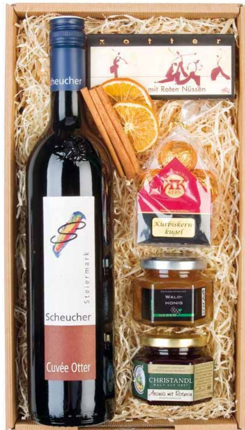
N° 7 Eine Flasche Cuvée Otter vom Weingut Scheucher 0,75l Waldhonig von der Imkerei Neber 125g Aronia mit Rotwein Marmelade vom Obsthof Christandl 110g